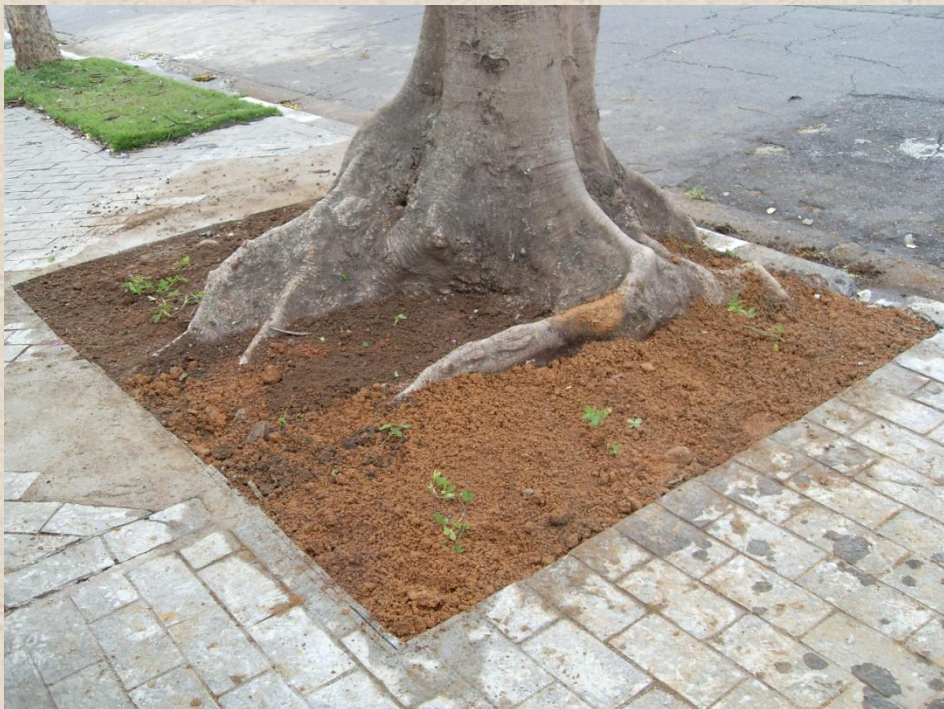
Imagem 2 – Esquema plantio