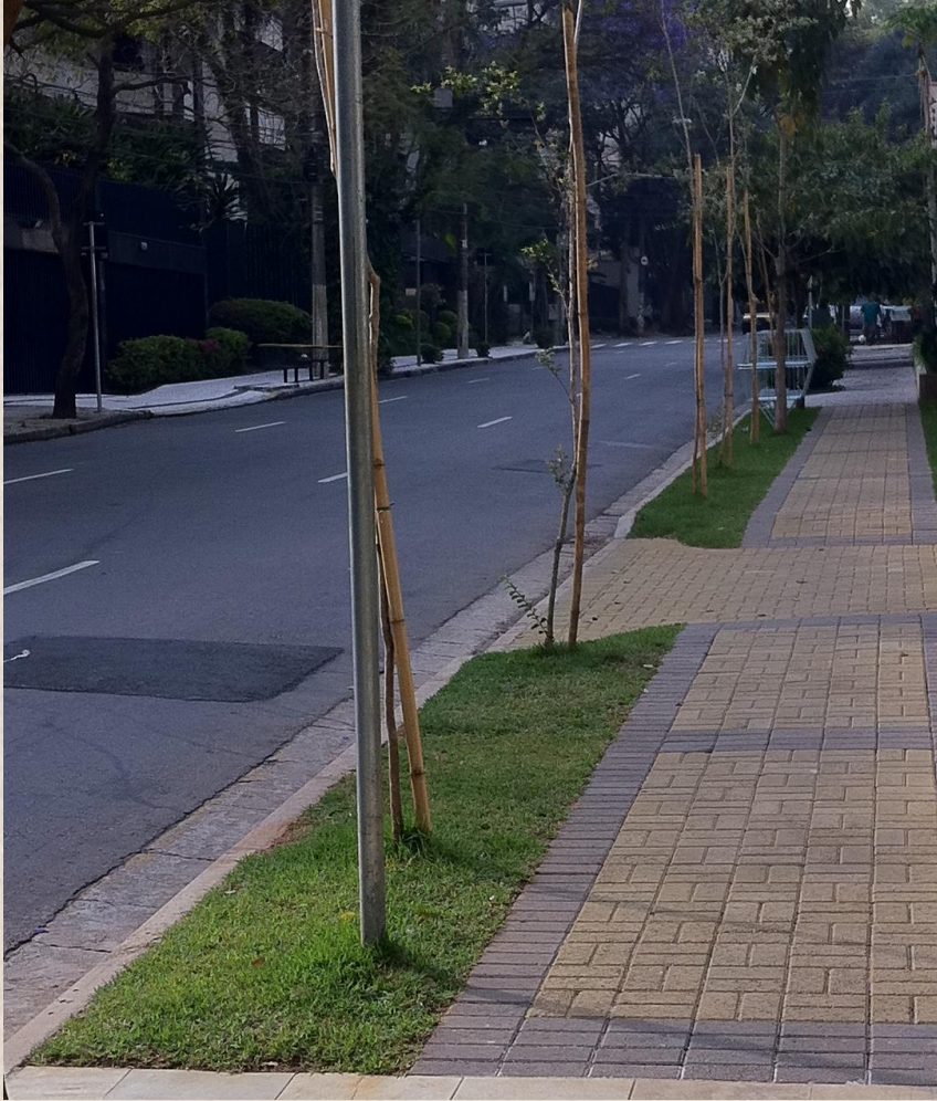
Imagem 7 – Parâmetros